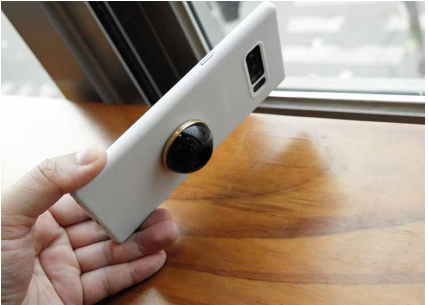
Handys machen immer bessere Bilder. Darf man aber alles und jeden fotografieren?